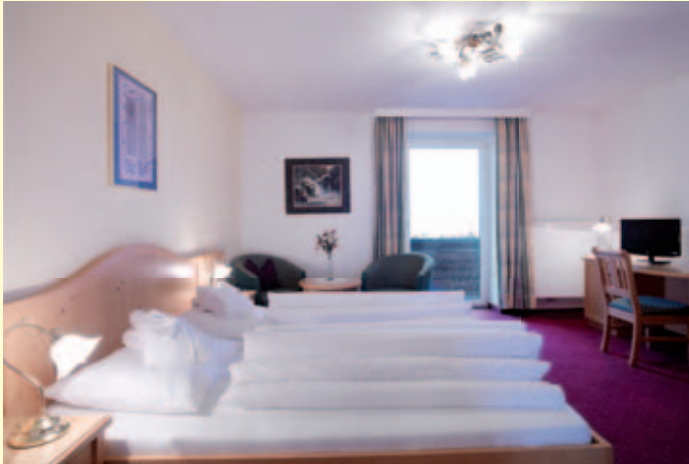
SUPERIOR Zimmer: Typ 1 A, 30 m 2 mit Inntalblick und Balkon

Ausstattung: Vorraum, moderne Badezimmer , Dusche/WC, Telefon, LCD-TV (Digital-TV und Radio), Zimmersafe, Haarföhn, Sitzecke und Schreibtisch