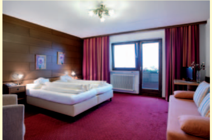
COMFORT Zimmer: Typ 1, 25 m 2 mit Inntalblick und Balkon

Ausstattung: Vorraum, moderne Badezimmer , Dusche/WC, Telefon, LCD-TV (Digital-TV und Radio), Zimmersafe, Haarföhn, Sitzecke