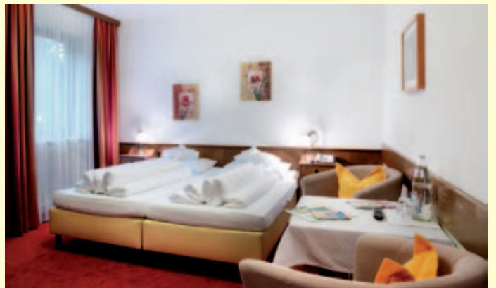
ECONOMY Zimmer: Typ 2, 16 m 2

CHECK IN: 14.00 - 18.00 UHR CHECK OUT: 08.00 - 11.00 UHR